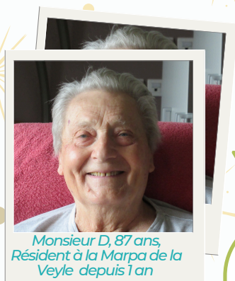
Monsieur D, 87 ans, Résident à la Marpa de la Veyle depuis 1 an

"Il fallait prendre cette décision pour avancer dans mon deuil et pallier la solitude. Ici, je sors quand je le souhaite, je m'organise pour prendre mes repas selon mes envies : c'est la liberté. C'est une belle surprise de la vie, d'être arrivé ici et d'avoir rencontré des personnes admirables. Je ne pouvais pas espérer mieux ! ici je me sens bien !"